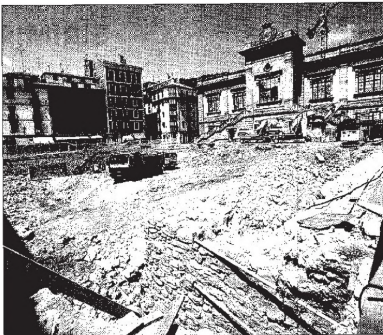
Las excavaciones afectaron a la plazoleta central de La Brecha pero ahora esta fase ha concluido. POSTIGO

El dictamen recuerda que «el aplazamiento de los pagos en el ámbito público se ha universalizado y se han reducido considerablemente los requisitos formales para acceder a ello». «Ante la facultad de adoptar acuerdos sobre extremos no regulados en el pliego de condiciones, que sean conformes a derecho y que no contravengan los intereses municipales y con la