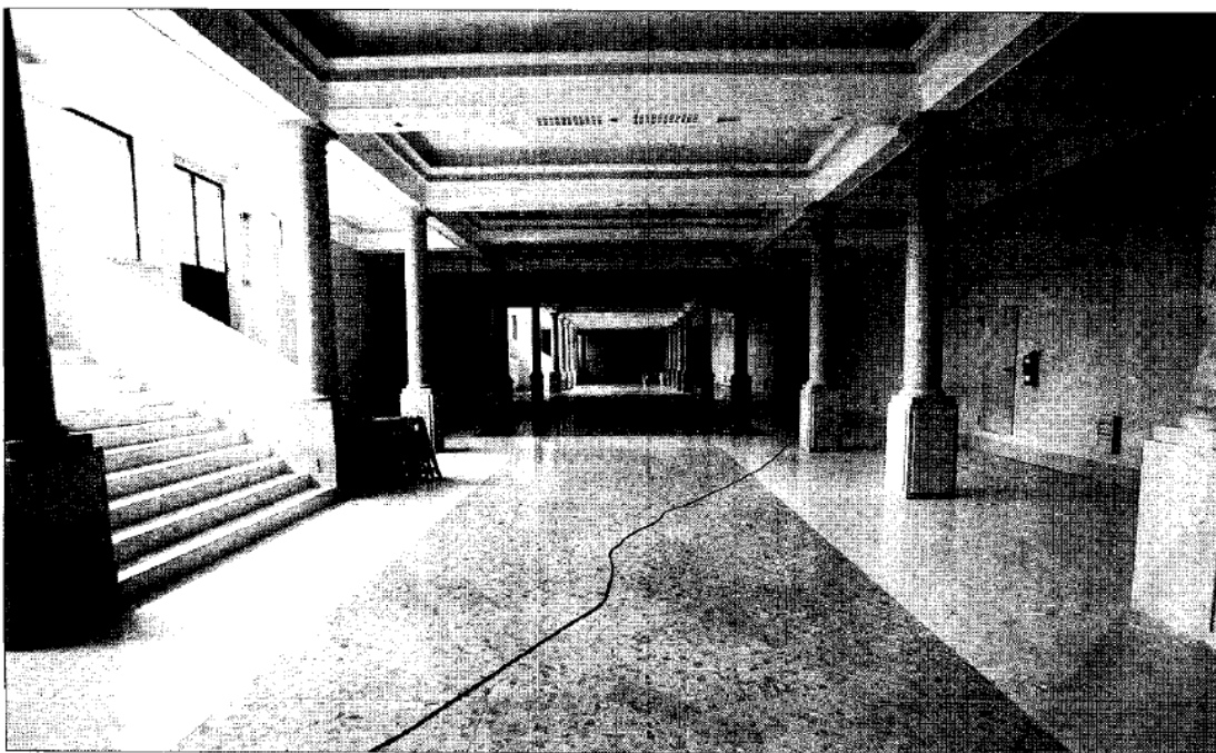
Los Bajos del Ayuntamiento están rehabilitados y desde el Patronato de Cultura se consideran buena ubicación para la biblioteca central.