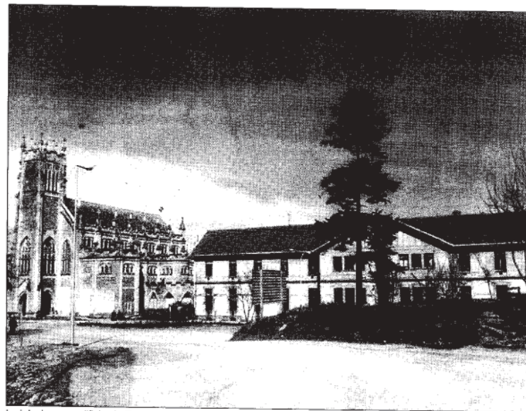
La iglesia y un edificio de Zorroaga, en cuyo entorno se construirán nuevos edificios.

tendría un total de 5.197 metros cuadrados construidos. «Se comunicará con el resto de los inmuebles de la Fundación Zorroaga a través de túneles que conectarán con los servicios centrales como puede ser el de la cocina y, a través de éstos con el tanatorio».