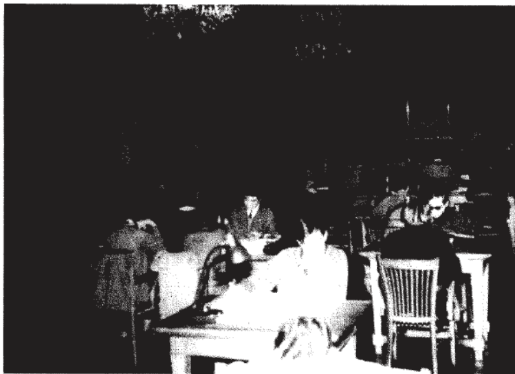
La biblioteca se instaló desde 1951 en el edificio del antiguo Ayuntamiento.