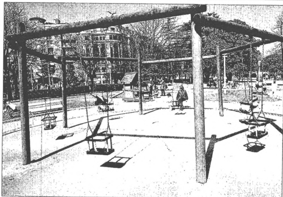
Los juegos infantiles del parque de Araba, sobre los que niños y padres han opinado este verano.