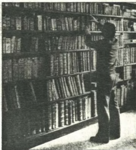
Los chavales, clientes habituales en las bibliotecas.

La Biblioteca Municipal sigue convocando sus dos concursos literarios, juvenil e infantil respectivamente. La edición correspondiente a este año del primero se acaba de hacer pública, con lo que está abierto el plazo de admisión de originales tanto en poesía como en prosa. El concurso infantil se falló recientemente y ahora va a cumplimentarse la segunda parte del mismo, el de dibujos sobre los ori-