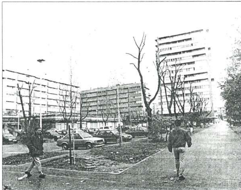
La renovación de pavimento, servicios y mobiliario urbano deberá ser total.