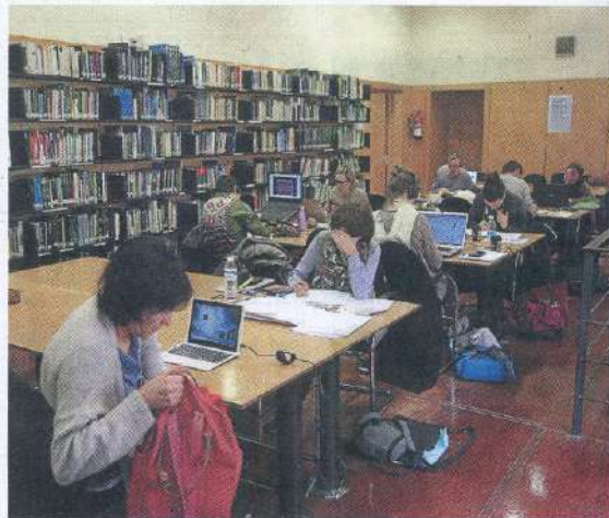
Una de las salas del Koldo Mitxelena donostiarrá.

hombres y el 54,37%, mujeres. Durante el pasado año, el centro registró 204.743 visitas, lo que supone un 4,75% más que en 2016 (195.450).