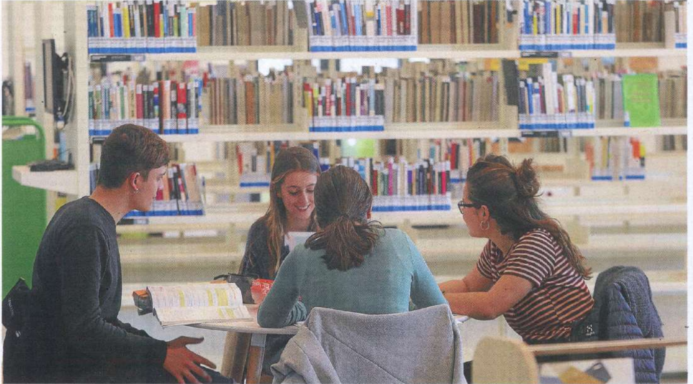
Cuatro jóvenes, el pasado viernes en las instalaciones de la biblioteca Ubik de Tabakalera.

La irrupción del libro electrónico reduce la demanda entre los usuarios aficionados a las novedades