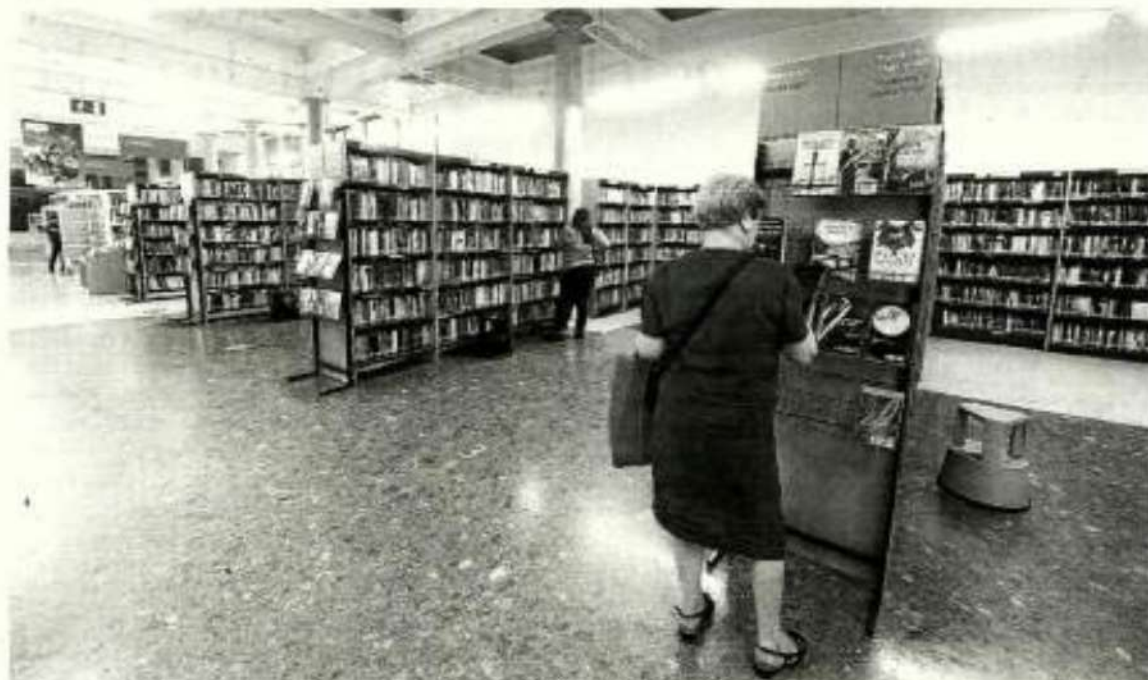
Una mujer consulta un libro en la Biblioteca Central de Alderdi Eder, ayer.

En la obra, la trompa es el instrumento que simboliza a la ballena, y también suenan la flauta, el oboe, el clarinete y el fagot, a los que se añade la percusión y el coro de Radio Televisión Española. - efe