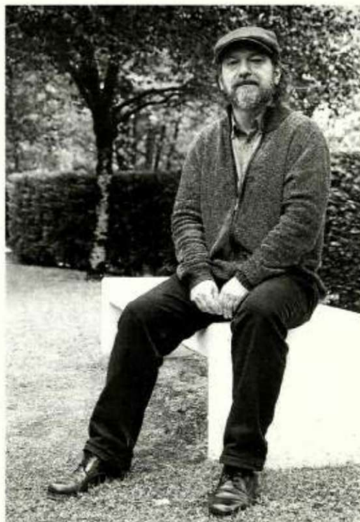
Loidi, en una imagen de archivo.