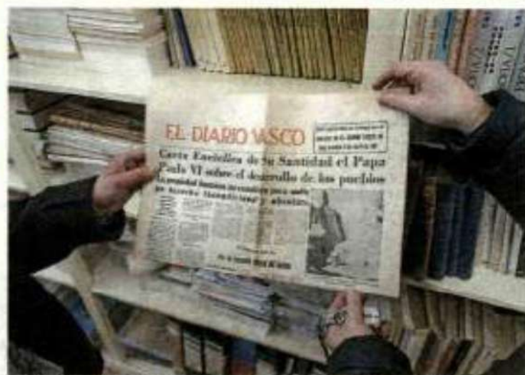
Marzo 1967, 'El Diario Vasco' se hace eco en su primera de la publicación de una encíclica revolucionaria, 'Populorum progressio'.