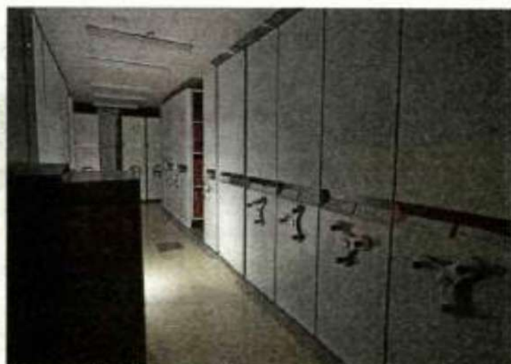
Libros, revistas, diarios que todos hemos leído descansan en atmósferas controladas bajo el suelo de la plaza.

mano en mano de los lectores se forran con fino plástico. Todos quedan fichados, etiquetados y protegidos contra un posible hurto. Y, 94 años después de aquel primer catálogo, se les incorpora el chip RFID (Radio Frequency Identification), sistema de almacenaje e identificación de objetos por radiofrecuencia que mejora el del código de barras y agiliza el proceso de auto préstamo.