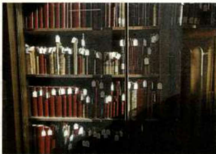
Normas del siglo XXI y del III Milenio para la catalogización, ningún código, ninguna etiqueta se pegará en el lomo del libro atesorado.