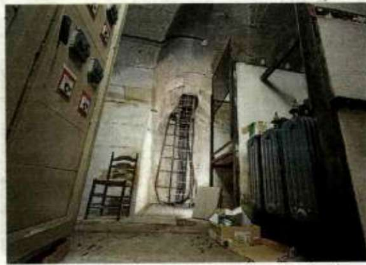
Transformadores de otros tiempos, testigos subterráneos de cómo se electrificó la ciudad.

pendencias de ese edificio que fue Ayuntamiento, que fue Biblioteca con archivadores fabricados en las grandes empresas cerradas a mano por funcionarios municipales que amaban el Cine y adoraban a Ingrid Bergman, es también atravesar distintas eras del arte y la ciencia de clasificar y conservar los libros. La misma Wikipedia define la palabra 'tejuelo' como 'etiqueta pegada en el lomo de un libro cuyo rótulo sirve para identificarlo y localizarlo'. Sin embargo, ningún licenciado moderno en Documentación, Archivo o Restauración daría por válida la expresión 'pegada'. La tendencia, más bien la ley, actual es evitar toda maniobra que pueda resultar agresiva o invasiva hacia la materia misma de la que están he-