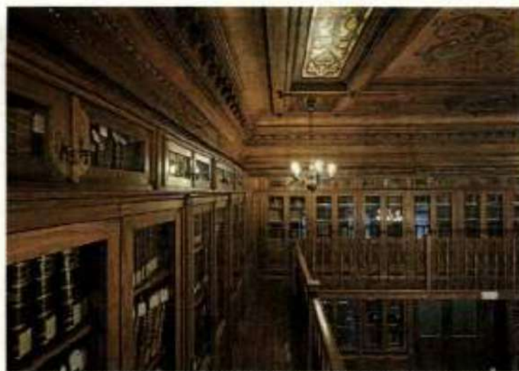
En esta sala amaderada que fue salón de lectura durante el siglo pasado se conservan los libros del Duque de Mandas y su esposa.