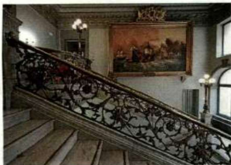
Sobre oros y mármoles, el cuadro tremendo narra la épica victoria del Almirante Oquendo sobre la flota holandesa.