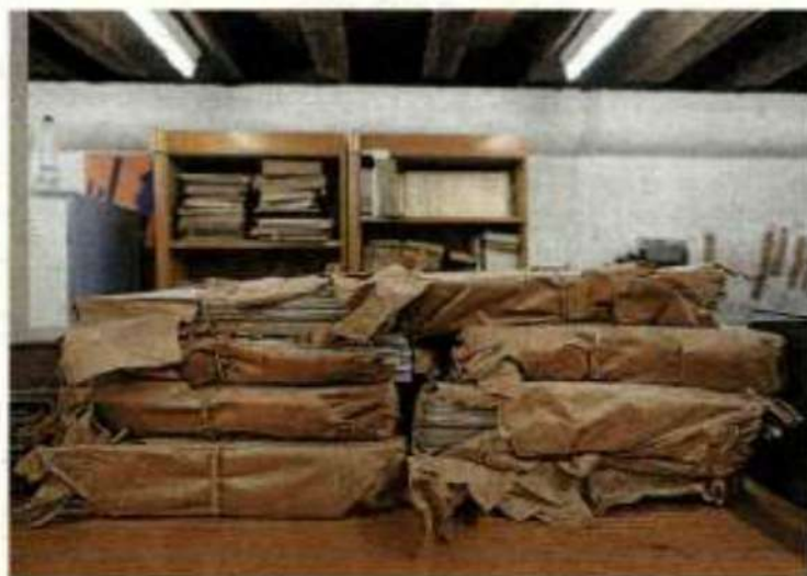
Revistas y periódicos a medio desempaquetar aguardan la decisión de ser catalogados, archivados, conservados o... no.