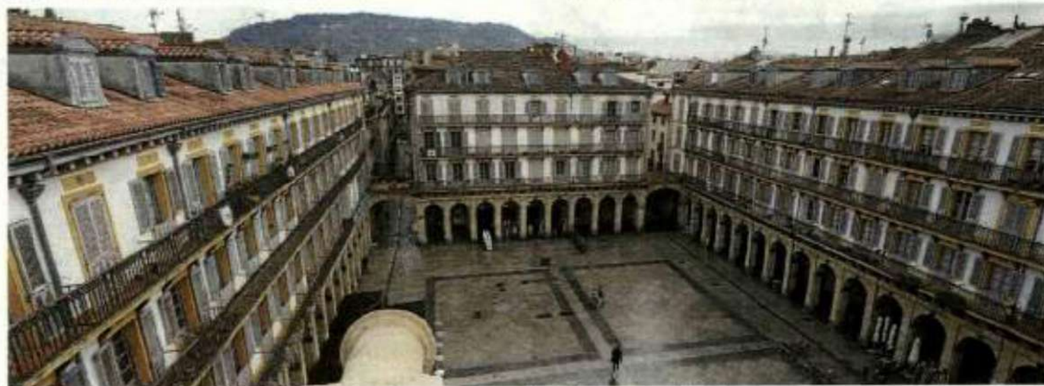
La plaza detenida por la cámara del fotógrafo desde la terraza coronada por la maquinaria del reloj.