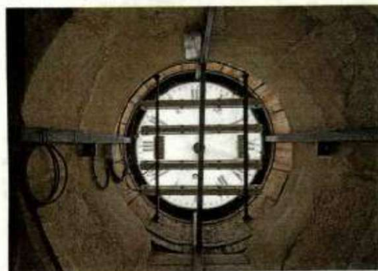
En el interior del reloj que marca el comienzo y el final de la fiesta del Día de San Sebastián.