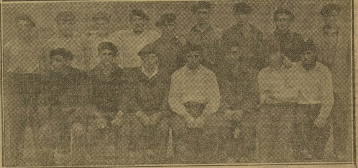
La tripulación de Pasajes de San Juan, compuesta en su mayor parte por elementos que formaron parte de la cuadrilla del año pasado

Rentería, 30 de Agosto de 1930. LA DIRECCION