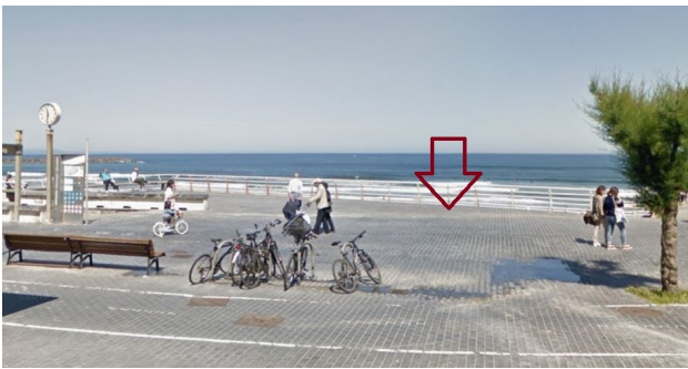
P11: Zurriola Pasealekua