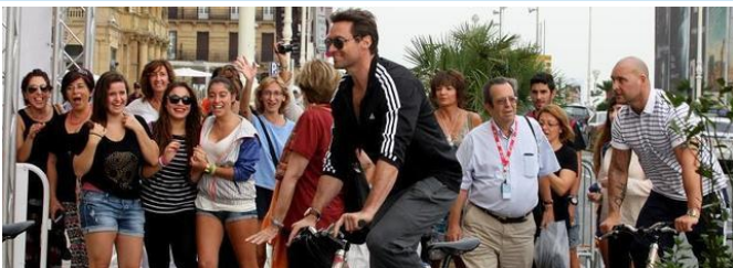
Hugh Jackman bizikletan (Donostia, 2013)