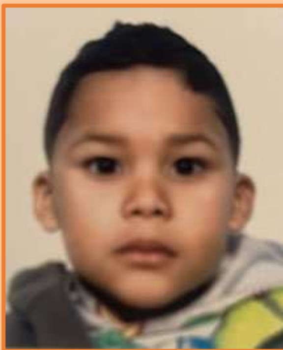
PALAFRENERO | PALAFREZAINA IAN MORCILLO PALACIO