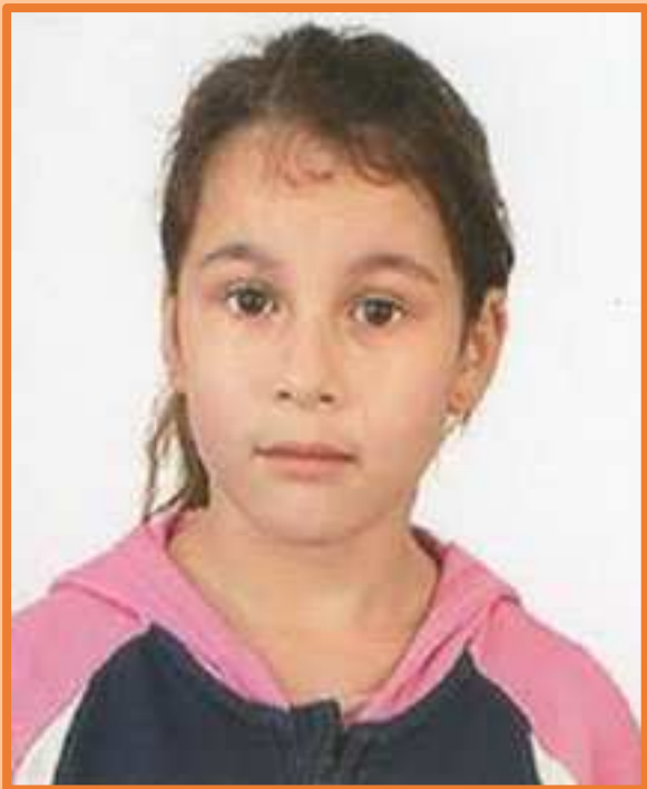
PALAFRENERA | PALAFREZAINA IRATI LLAMAZARES EGÜES