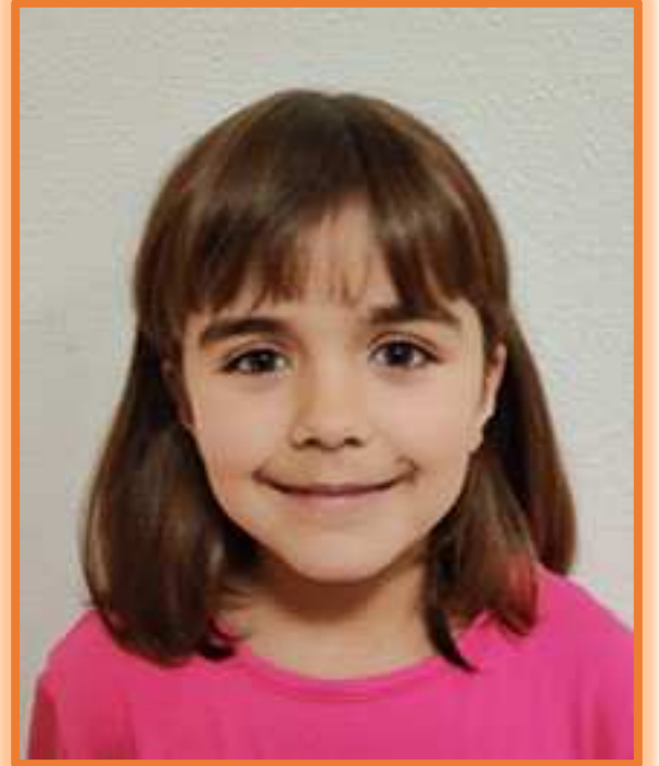
PALAFRENERA | PALAFREZAINA MARE LIZARRAGA CASTILLO