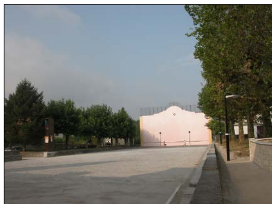
Autor y fecha desconocidos.