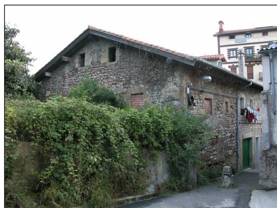
Autor y fecha desconocidos.