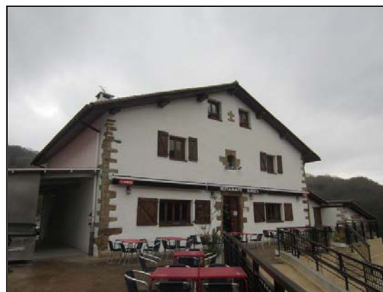
Autor y fecha desconocidos.