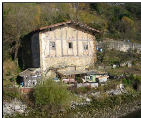
Autor y fecha desconocidos.