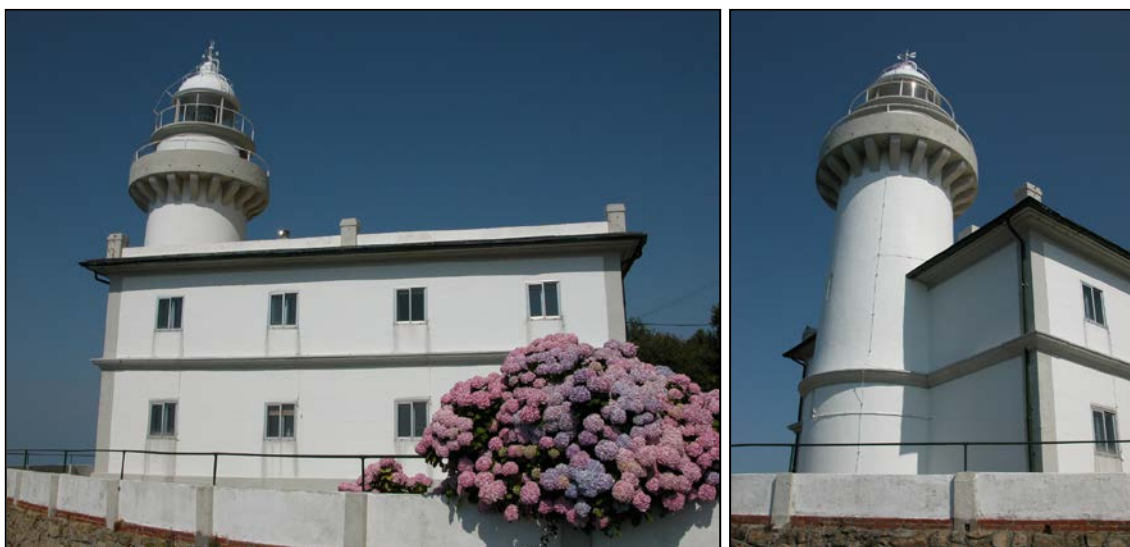
Autor y fecha: atribuido a Manuel Peironcely; 1855