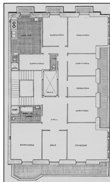
Autor y fecha: Ramón Cortazar; 1917.