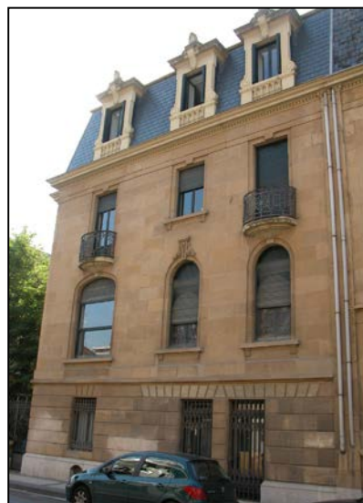
Autor y fecha: Ramón Cortázar; 1926.