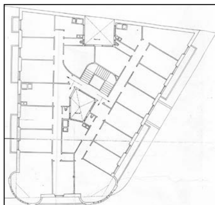
Autor y fecha: Ramón Cortázar; 1920.