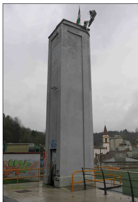
Autor y fecha: Juan Domínguez; 1946