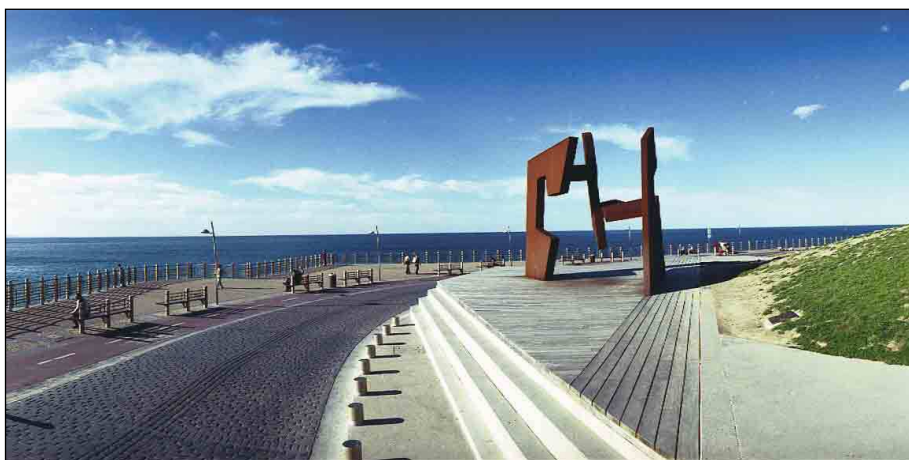
Autor y fecha: Jorge Oteiza y; 1957-2002.