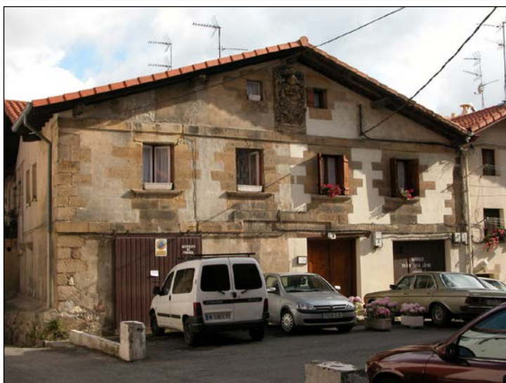
Egile eta data ezezagunak