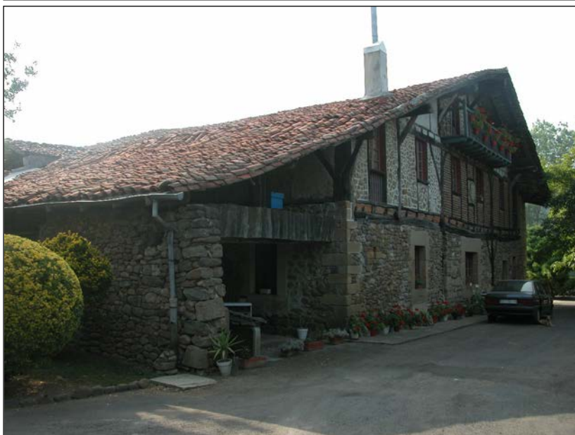
Egile eta data ezezagunak