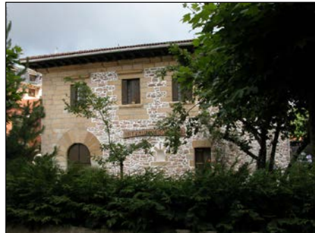
Egile eta data ezezagunak