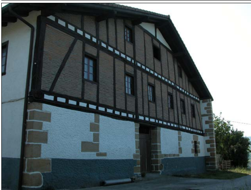
Egile eta data ezezagunak