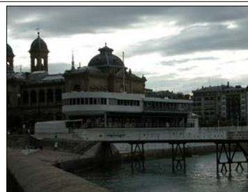
Egilea eta data: Jose Manuel Aizpurua eta Joaquin Labayen; 1929