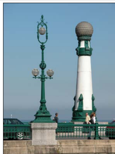
Egilea eta data: J. Eugenio Rivera eta Victor Arana, 1915