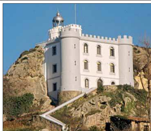
Egilea eta data: ezezagunak; 1855