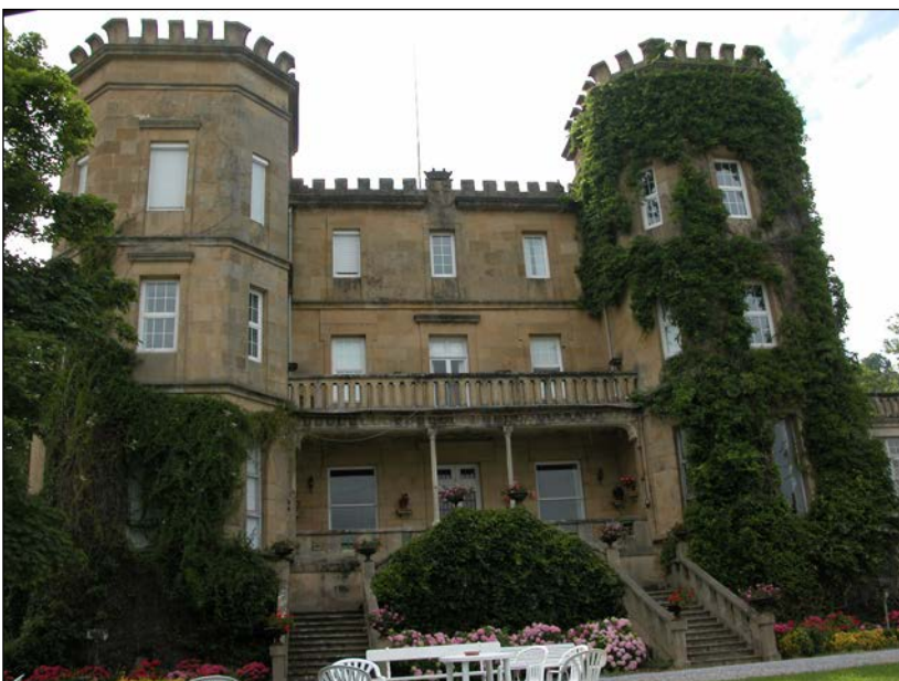
Egile ezezaguna, 1883