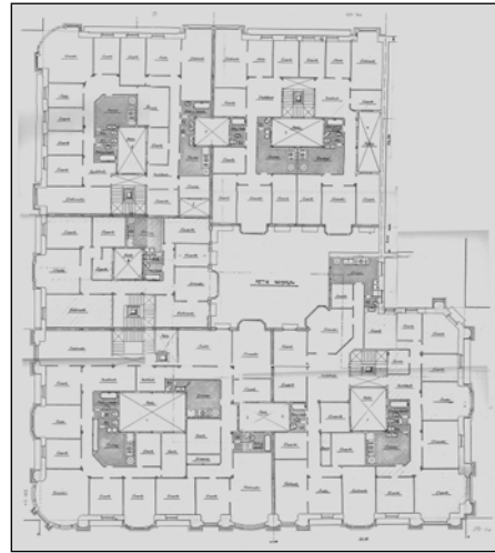
Egilea eta data: Ramon Cortazar; 1900 eta 1916.