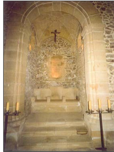
Egile eta data ezezagunak.