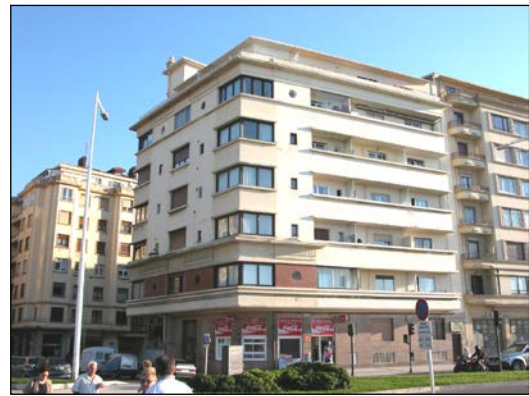
Florencio Mokoroa, 1936.