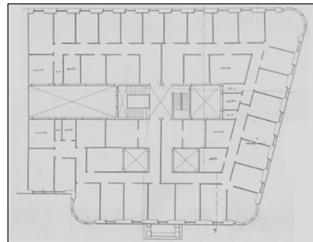
Egilea eta data: Jose de Gurruchaga, 1914.