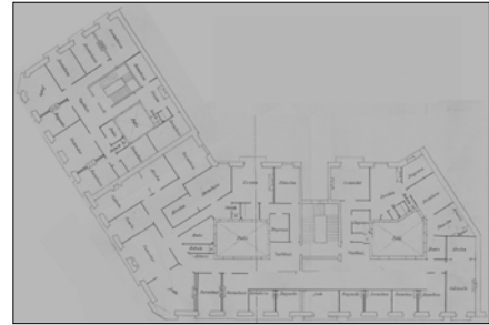
Egilea eta data: Jose Clemente de Osinalde; 1892.