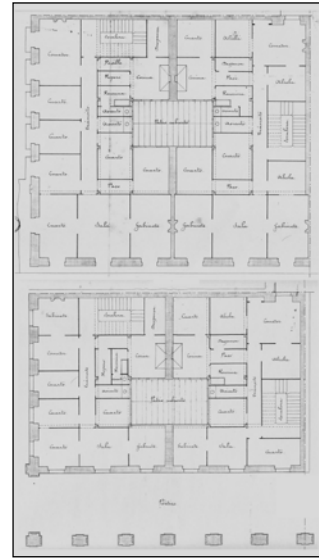
Egilea eta data: Jose Eleuterio de Escoriaza, 1867