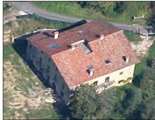
Egile eta data ezezagunak