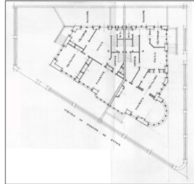
Egilea eta data: Eduardo Lagarde, 1932