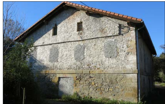
Egilea eta data: ezezagunak.