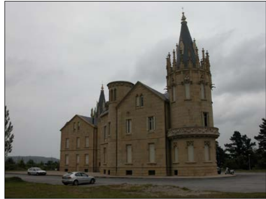
Egile ezezaguna, 1903