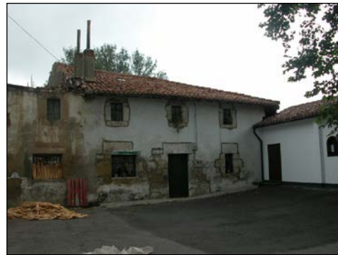
Egile eta data ezezagunak.