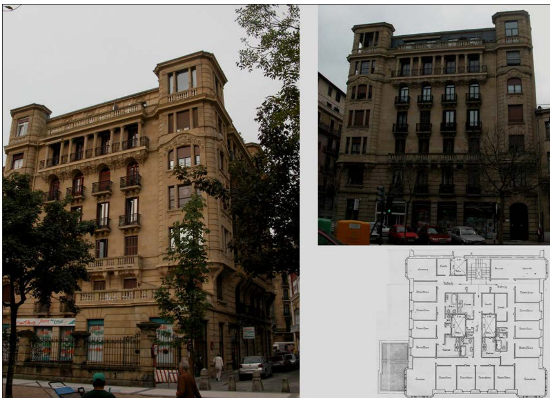
Egilea eta data: Ramon Cortazar, 1923