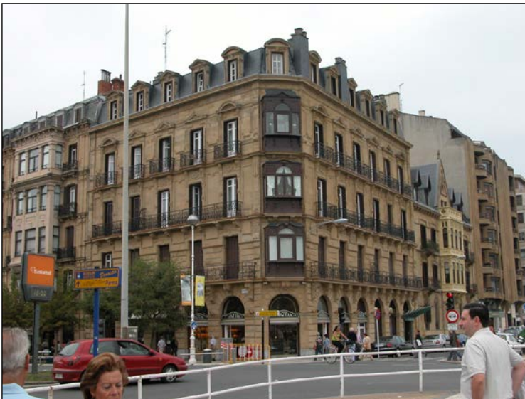
Egilea eta data: Manuel Urcola eta Eceiza, 1885