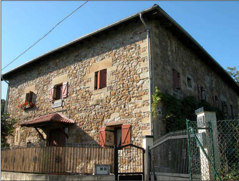
Egile eta data ezezagunak