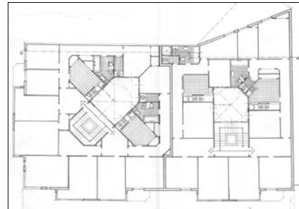
Florencio Mocoora Gastesi, 1947.