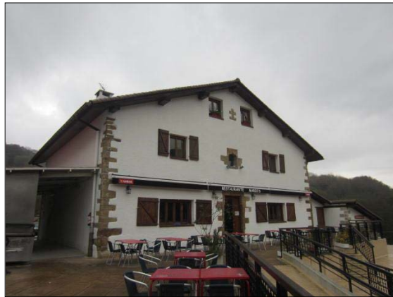
Egile eta data ezezagunak