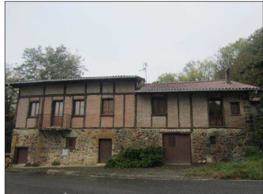
Egile eta data ezezagunak