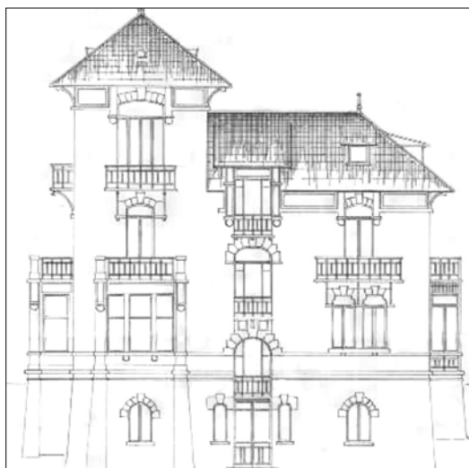
Ramon Kortazar, 1908.